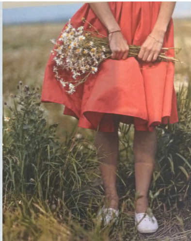
Norbert Scheuer Flussabwärts