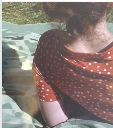
Norbert Scheuer Die Sprache der Vögel