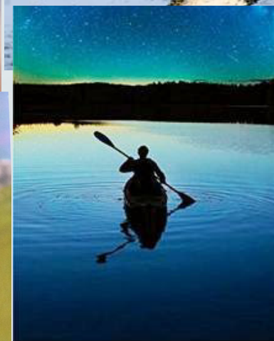
Norbert Scheuer Am Grund des Universums