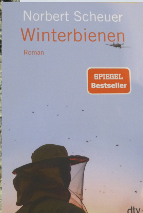
Norbert Scheuer Winterbienen