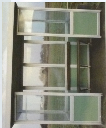
Norbert Scheuer Kall, Eifel